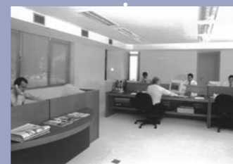
Início da expansão internacional (Londres, São Paulo e Nova Iorque)