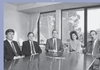
Finantia obtém licença bancária