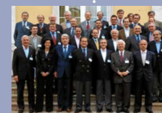
Prémio Euromoney "Best Smaller Bank in Europe"