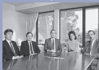
Finantia obtém licença bancária