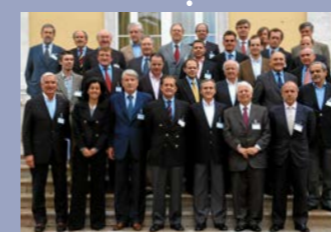
Prémio Euromoney "Best Smaller Bank in Europe"