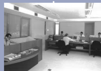
Início da expansão internacional (Londres, São Paulo e Nova Iorque)